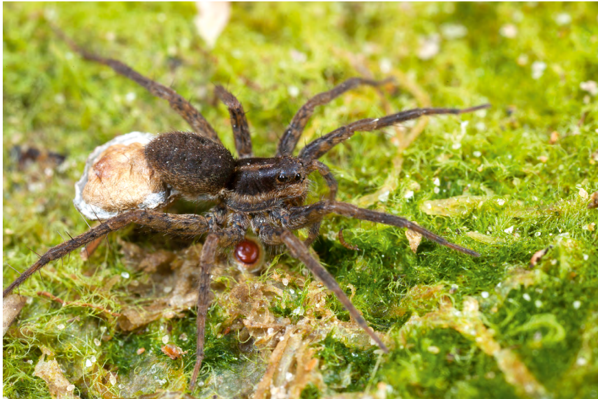
■ La Pardose des prés salés ( Pardosa purbeckensis ), classée en catégorie "En danger"