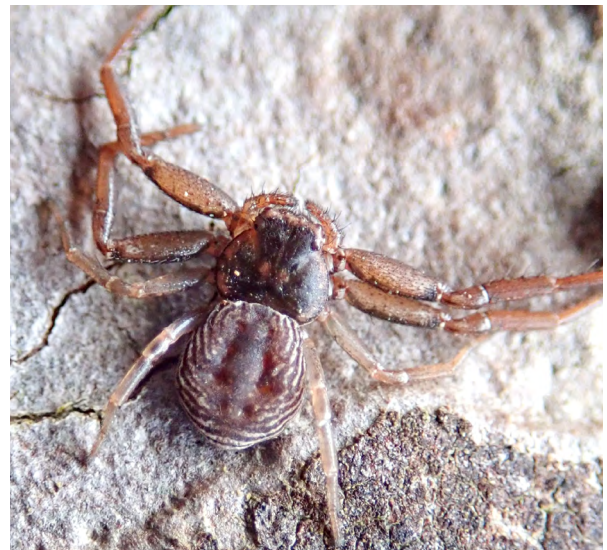
■ Le Thomise frippé ( Coriarachne depressa ), une araignée "En danger" vivant sur et sous l'écorce des résineux de forêts anciennes