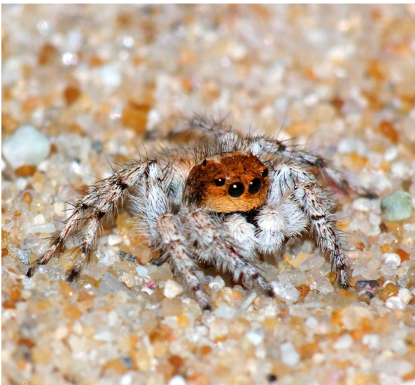
■ L'Asianelle de Bosmans ( Aelurillus bosmans ), trouvée dans les milieux sableux et maquis rocheux corses, classée "Vulnérable"