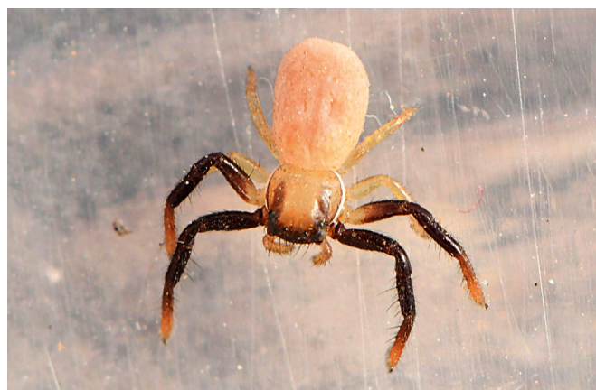
■ Le Firmicus à deux bandes ( Firmicus bivittatus ), appartenant à la famille des araignées-crabes, est une espèce rare et discrète des prairies écorchées méditerranéennes, classée en catégorie "Données insuffisantes" en raison du manque d'informations sur sa répartition

Au final, l'état des lieux a porté sur 1 622 espèces d'araignées. Le bilan synthétique est présenté en page suivante et les résultats détaillés p. 11 à 18.