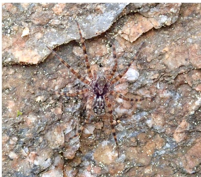
■ La Petite Lycose des Sudètes ( Acantholycosa norvegica ), classée "En danger critique", habite les éboulis froids et les grottes glacées, se fondant dans son environnement par son apparence cryptique

L'évaluation a été menée par le Comité français de l'UICN et PatriNat (OFB-MNHN-CNRS-IRD), en collaboration avec l'Association Française d'Arachnologie (AsFra). Elle a bénéficié de la contribution d'auddicé et du GON pour la coordination de la phase préparatoire, et du soutien de l'UMR TREE (Université de Pau - CNRS) pour la cartographie et les statistiques. Elle a mobilisé les connaissances de spécialistes pendant près de trois ans, qui ont apporté leur expertise pour la compilation et la vérification des données, ainsi que pour l'établissement des analyses préliminaires. Douze d'entre eux ont ensuite participé à la validation collégiale des résultats lors d'un atelier organisé sur sept jours en mars 2022. Une catégorie a alors été attribuée à chaque espèce selon la méthodologie de l'UICN. Les résultats ont ensuite été consolidés conformément au référentiel taxonomique national TaxRef.