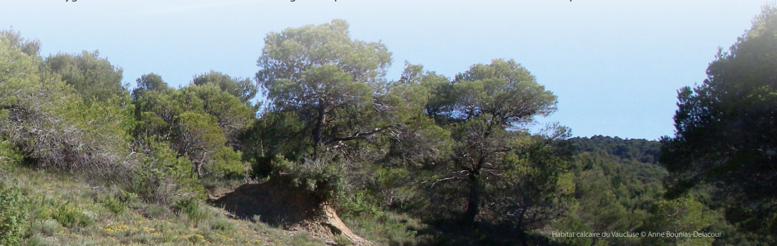
Habitat calcaire du Vaucluse

Malgré les menaces qui pèsent sur les araignées, aucune espèce ne fait à ce jour l'objet d'un programme de conservation dédié ou de mesures de protection spécifiques. Les résultats de la Liste rouge contribueront à orienter les stratégies d'acquisition de connaissance et les priorités d'action pour sauvegarder la diversité de ces espèces. L'état des lieux souligne l'importance de la préservation des habitats naturels pour assurer la conservation de cette faune exceptionnelle.